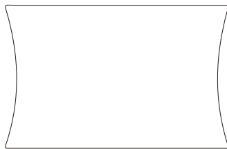
Bovenaanzicht plastic voetplaat